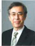
東京大学大学院 リハビリテーション医学 教授