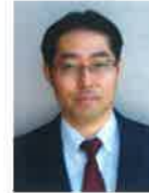
国際医療福祉大学病院 リハビリテーション科 教授