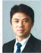
横浜市立大学 リハビリテーション科学 教授