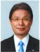
日本リハビリテーション 医学教育推進機構 理事長