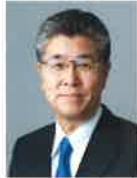
日本急性期 リハビリテーション医学会 理事長