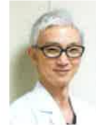
東京慈恵会医科大学 リハビリテーション医学講座 准教授