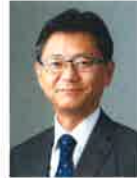
帝京大学 リハビリテーション科 教授